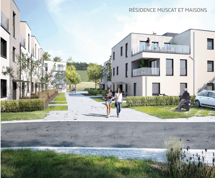
RÉSIDENCE MUSCAT ET MAISONS