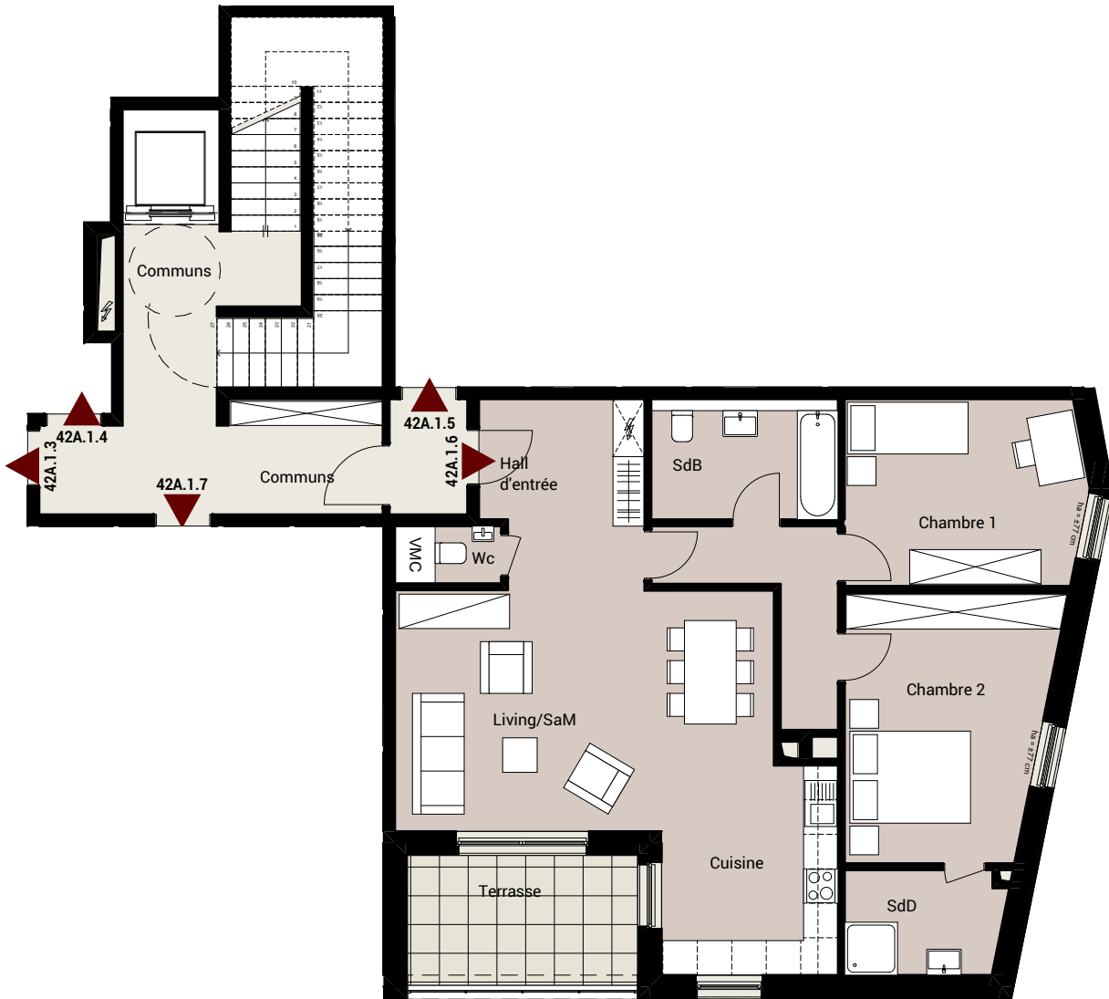
Echelle 1:120 0m 1m 2m 3m 4m 5m 6m